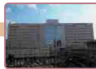
広島大学病院外観