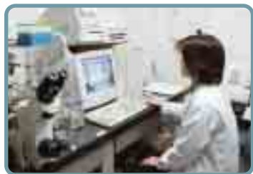
細胞内カルシウム濃度測定機器

このようなことから、今や、蕁麻疹と言えば広大・皮膚科というイメージがすっかり定着。秀教授自身、「知人から、